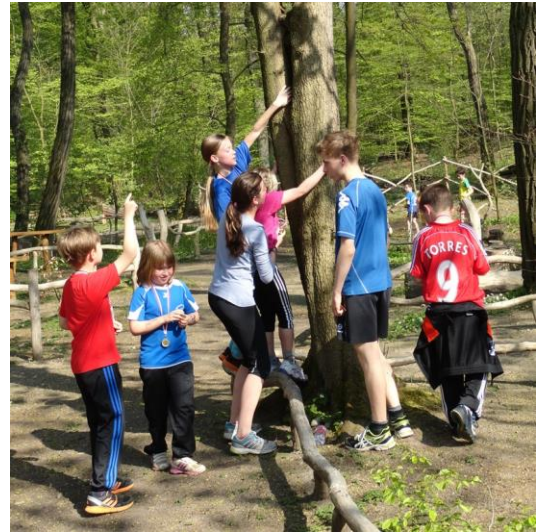
Alles wird abgesucht: der Boden – und die Bäume.